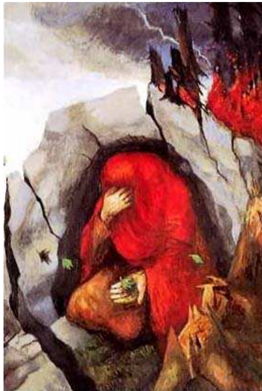
Il profeta Elia ascolta Dio

Ci benedica Dio, che è Padre, Figlio e Spirito Santo! Amen!